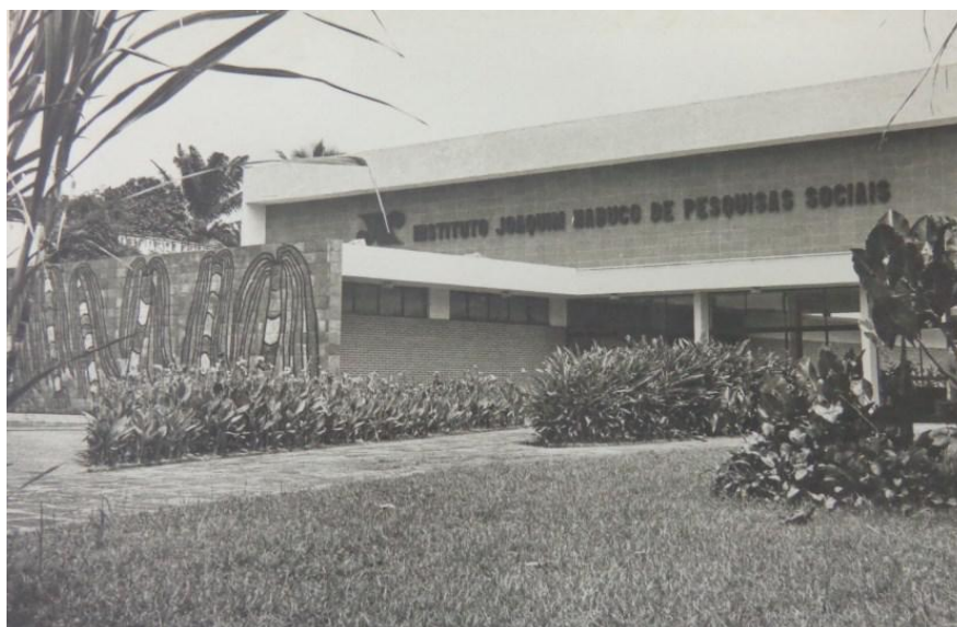
Fachada do Instituto Joaquim Nabuco de Pesquisas Sociais, ao final da década de 1960.